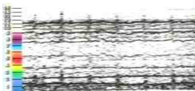
Semnătura câmpului sănătos

Această coerență apare pe un grafic ca niște unde line, blânde, puțin adânci distribuite echilibrat peste tot în spectrul de frecvențe (figura următoare).